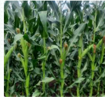
Aina ya mahindi yenye kinga dhidi ya MLN