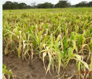
Aina ya mahindi isiyo na upinzani dhidi ya MLN